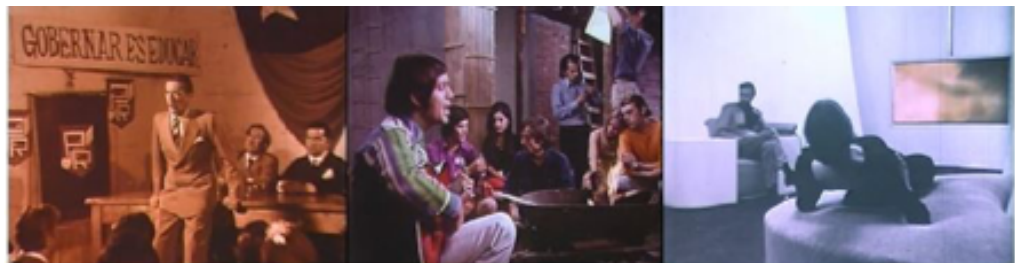
Imagen N° 7: Fotogramas de la película La casa en que vivimos , 1970.