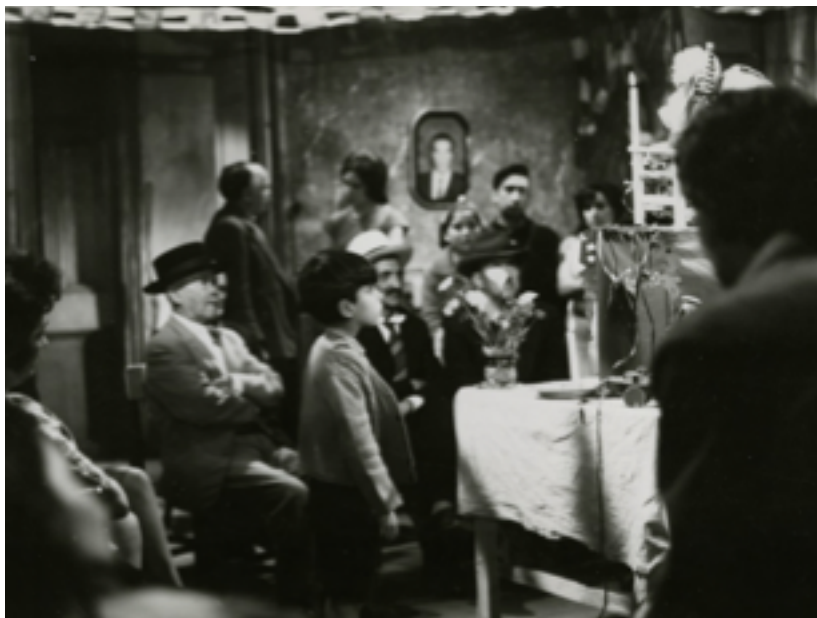
Imagen N° 3: Fotograma de la película Largo viaje , 1967.

En este apartado profundizaremos sobre los inicios de Patricio Kaulen en el cine y su importante paso por el desarrollo documental. Luego nos adentraremos en el trabajo que realizó como presidente de Chile Films y la importancia que tuvo en el resurgimiento del cine chileno de la época. En tercer lugar, profundizaremos respecto a sus largometrajes Largo viaje (1967) y La casa en que vivimos (1970), a partir de una reflexión en torno a sus obras que considere la comprensión de los motivos y condiciones de la creación visual. Finalmente, presentaremos una reflexión respecto a la valoración y los aportes de Kaulen para el cine chileno.