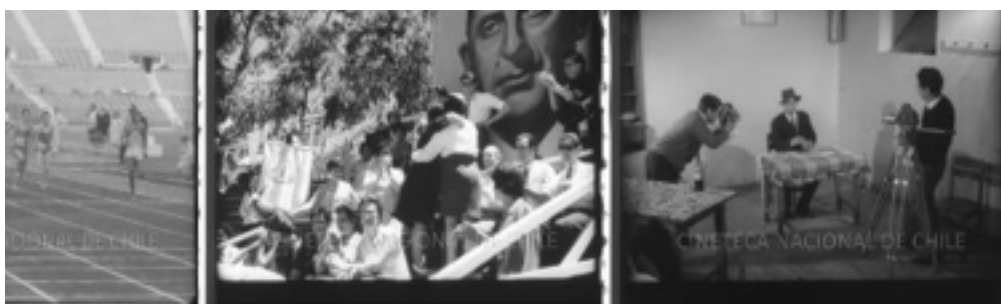
Imagen N° 6: Fotogramas del documental Chile en marcha: Chile que surge , 1956-1959.

Los noticieros Chile en marcha , al igual que otros documentales, cortometrajes o anuncios, se exhibían en las salas de cine comercial antes de las funciones de las películas. Esto fue una práctica recurrente en este periodo, puesto que la televisión aún tenía una cobertura limitada en los hogares, y, para efectos de este noticiero, no existía una señal de televisión pública de cobertura nacional que permitiera transmitir su señal en todo el territorio. Los noticieros, entonces, se proyectaban en salas de cine de manera quincenal, al principio solo en las salas del centro de Santiago, para luego llegar a los barrios y a diferentes ciudades (Archivo CMEFM, 2018). Por las características de la tecnología fílmica disponible en los años sesenta, la mayoría de este material se grabó en rollos de acetato de 16 milímetros, en blanco y negro y sin sonido, para posteriormente ser editado por parte de Chile Films para su exhibición en cines. Con el tiempo y los avances tecnológicos, logró difundirse en un formato de 35 milímetros y a color.