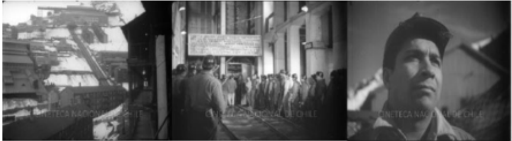
Imagen N° 4: Fotogramas del documental La minería en marcha: Sewell, ciudad del cobre , 1956